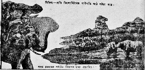
অসম চৰকাৰৰ পৰ্যটন বিভাগৰ দ্বাৰা প্ৰচাৰিত ।

নিৰিখ:—প্ৰতি কিলোমিটাৰত গাইলতি আঠ পইচা মাত্ৰ ।