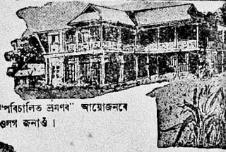
“পরিচালিত ভ্রমণৰ” আয়োজনৰে ওলাপ জনাৰ্ঠ ।